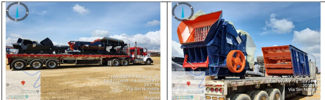
Fotografías 7 y 8. Arribo de maquinaria para posterior ensamble y operación.