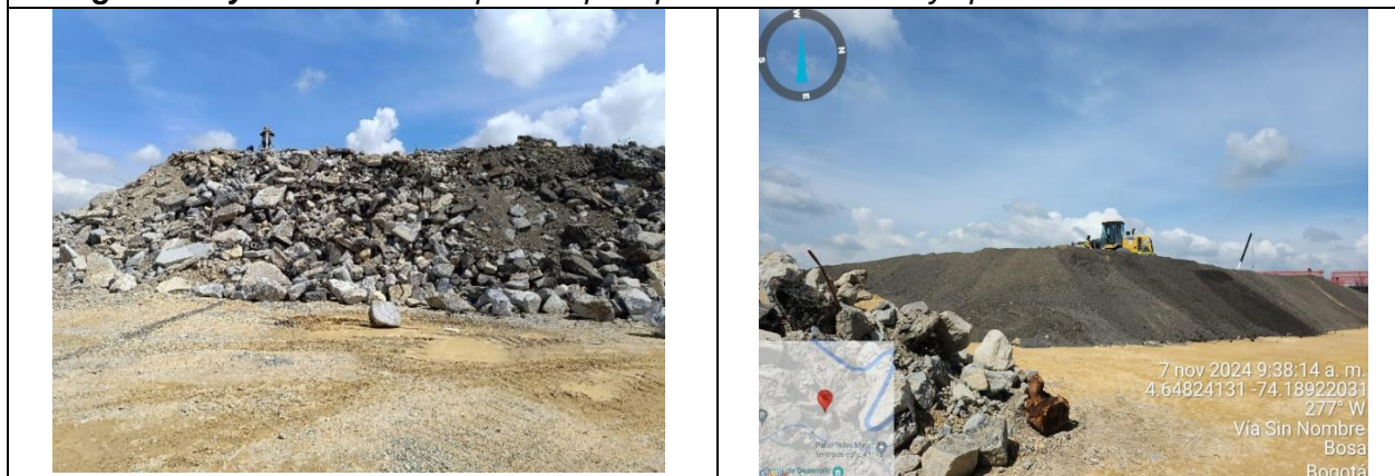
Fotografía 9. Acopio de residuos para transformación